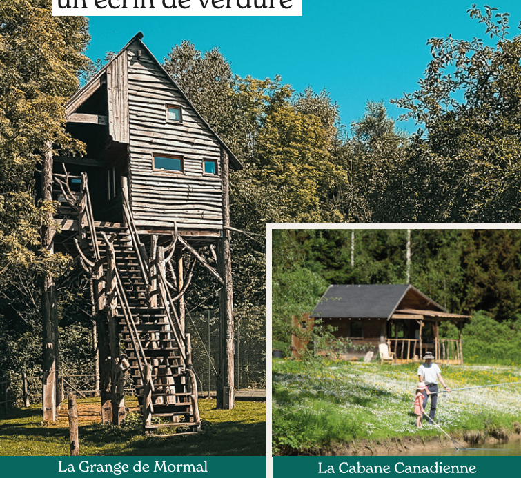
La Grange de Mormal